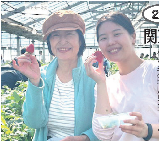
〔左〕いちごはうす西脇(横須賀市)で甘いイチゴと浦賀分会手作りの熱々おでん等を堪能しました。 〔下〕京急「三浦海岸」駅から線路沿いの道は河津桜と菜の花が見頃でした。